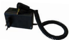
Art nr. 17134 (18V) Art nr. 19010 (24V) Batteriladdare