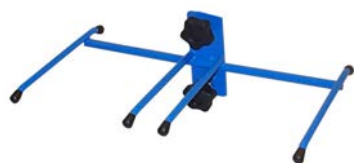
Art nr.15015 Soppåsehållare, dubbel