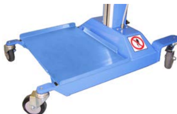
Art nr. 15024 Backhållare för tomma backar, så hålls golvytan fri.