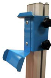
Art nr. 15019 Vinkel till saldohållaren