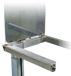
Art nr. 15029 Adapter, för hantering av backar med olika bredd