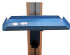
Art nr. 15016 Förvaringshylla