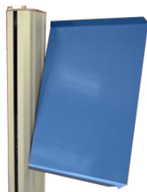
Art nr. 15017 Skrivpulpet