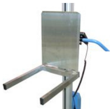
Art nr.15012 Lastflak, Apoteksmodell