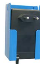
Art nr.17230A Batteriladdhållare